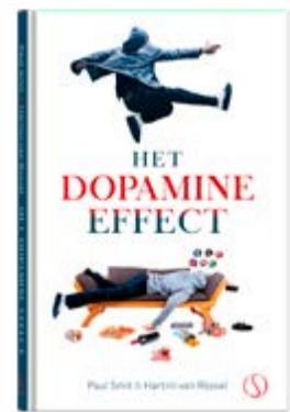
Het Dopamine Effect dakl.nl/boek-dopamine-effect