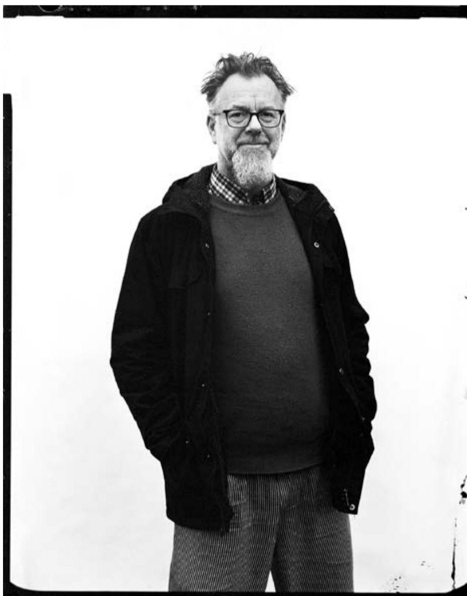
Tekst: Ad Nuis

Wat goed werkt om bestaande patronen te doorbreken, is bij aanvang een project een experiment te noemen. Bij gemeentes en investeerders zitten ook mensen die het anders willen. Een experiment mag mislukken en risico's kunnen gemanaged worden. Daarom is het gemakkelijker voor mensen binnen strakke structuren en vastgeroeste gewoontes om mee te doen. Zo kun je veranderingen tweebrengen. ■